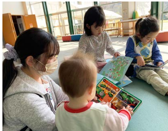
寄贈図書一覧 (国際ローター第2550地区 ローターアクト一同 様)

https://www.city.sano.lg.jp/soshikiichiran/kodomo/kodomoka/oshirase/23773.html