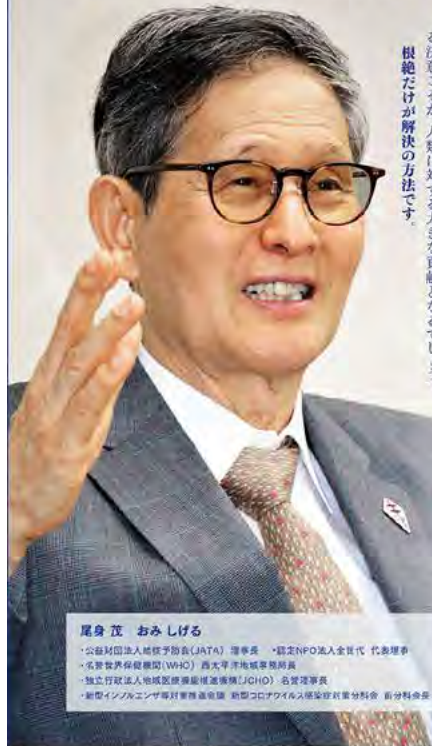
尾身 茂 おみしげる 公益財団法人結核予防会(JATA) 理事長、国際NPO法人全世代 代表理事...