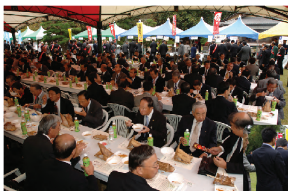
屋台村も出店しての昼食会場風景