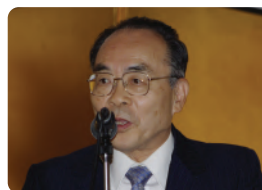
瀬下龍夫ガバナー・エレクトのご挨拶と次期地区大会開催の壬生RCのPR