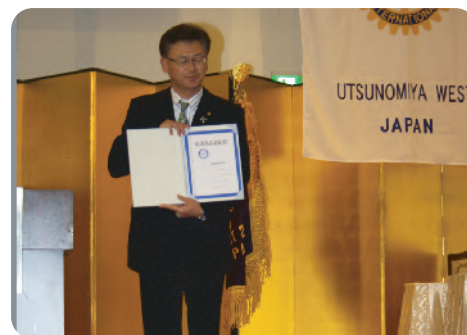
「意義ある業績賞」の受賞を受取る(鹿沼東RC)