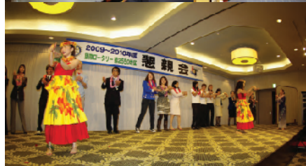
フラダンスショーで大盛況の懇親会