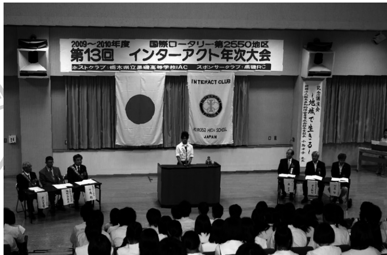
インターアクト小林副会長 開会の辞

振り返って見ると、「恕」「CHANGE」「他利生」という言葉の中に「思いやり」の一貫性が感じられる年次大会でした。