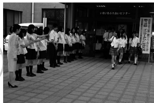
年次大会を終えて