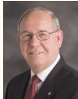
国際ロータリー会長 レイ・クリンギンスミス (米国ミズーリ州カークスビル)

2009-10年度 国際ロータリー会長エレクト 2005-06年度 ロータリー財団副管理委員長 2002-06年度 ロータリー財団管理委員 1985-87年度 国際ロータリー理事 1975-76年度 地区ガバナー