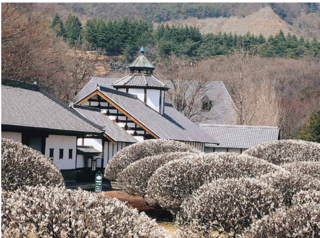
白梅の香り(栗田美術館)