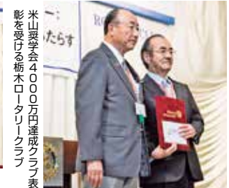
米山製学会4000万円達成クラブ表彰を受ける栃木ロータリークラブ表