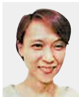
しん づいてー 沈 子 庭