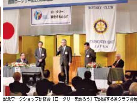
記念ワークショップ研修会 (ロータリーを語ろう) で討論する各クラブ会長