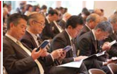
地区大会参加者の皆様