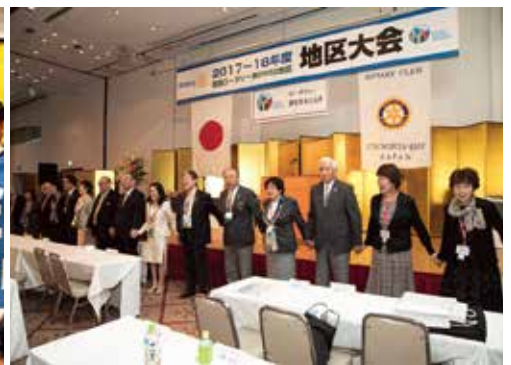
参加者全員による「手につかないで」合唱