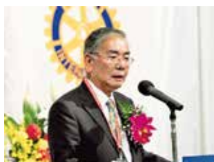
石黒慶一RI会長代理ご挨拶