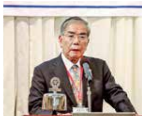
挨拶する石黒慶一RI会長代理