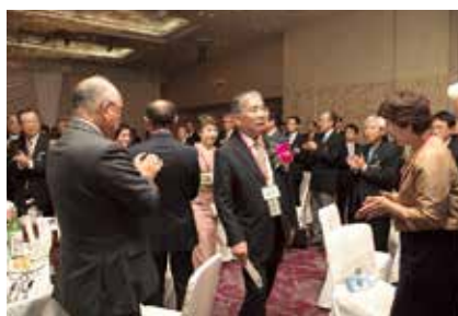
歓迎を受けて入場する石黒慶一RI会長代理