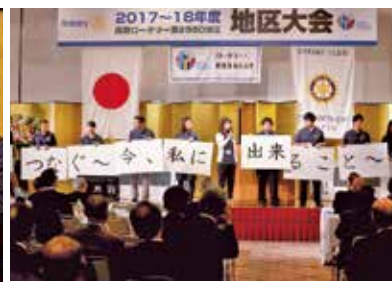
ローターアクト活動を報告するローターアクターの皆様