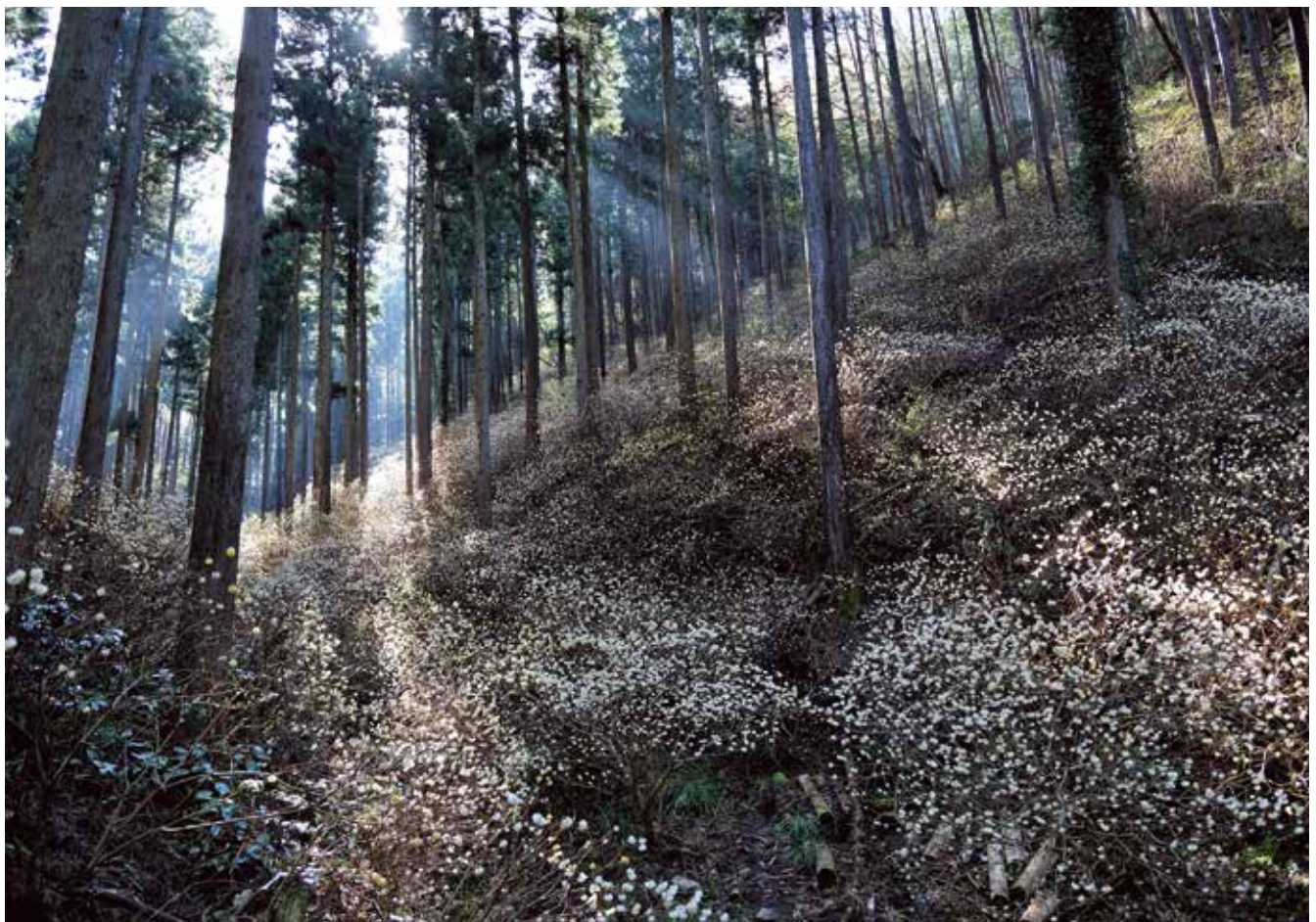
『木漏れ日のミツマタ群生』