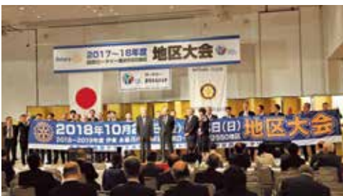
次年度地区大会開催ホストクラブ宇都宮西RC実行委員の皆様