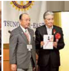
記念事業目録贈呈 福田富一 栃木県知事へ