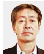
いぐち また お 猪 口 又 雄