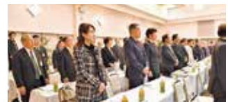
会長・幹事会に出席の皆様