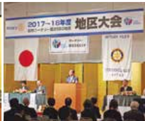
青木格次地区大会実行委員長挨拶