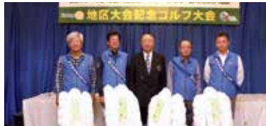
表彰式 団体の部優勝チーム 宇都宮東RCチーム