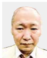
はや みず みち ひろ 速 水 理 洋