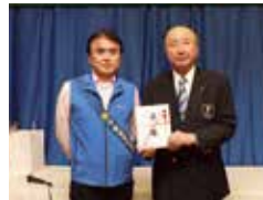
チャリティー「ロータリー希望の風裂学舎」へ寄付