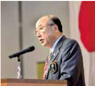
太城敏之ガバナー挨拶