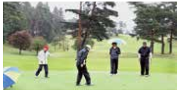
羽石バスタガバナーチーム グリーンにて