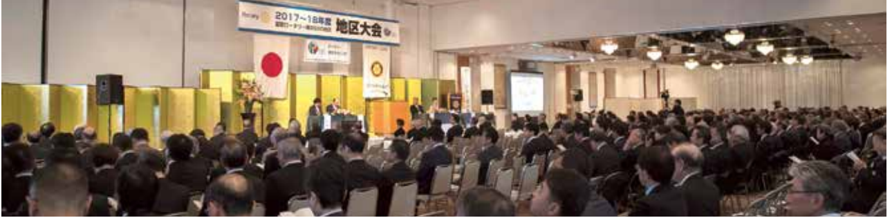
地区大会本会議 (9時05分開会・点鐘にて開始)