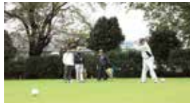
太城ガバナーティーショット