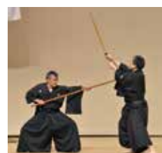
古武道 荒木流拳法