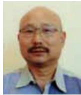
さん のう いつ お 山納 五月男