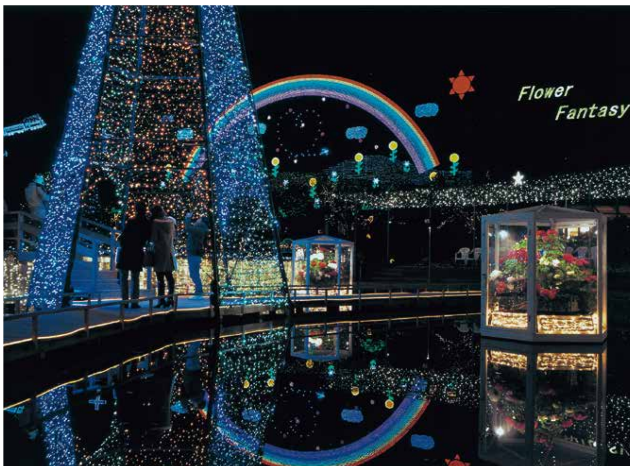
光のおもてなし(足利フラワーパークにて)