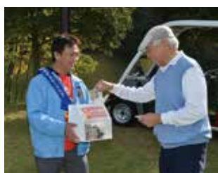
ポリオ撲滅チャリティー