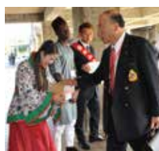
米山記念奨学生と太城敏之ガバナーエレクト