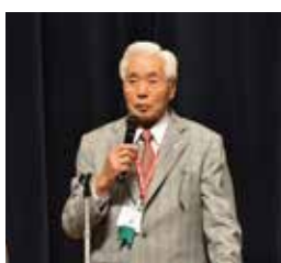
栃木秀磨ガバナーの挨拶