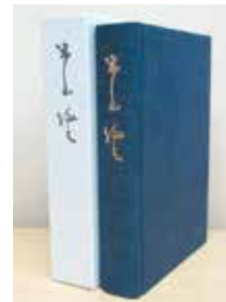
A5判 上製本ケース付 本文590ページ/4,000円