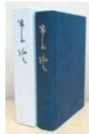
A5判 上製本ケース付 本文590ページ/4,000円