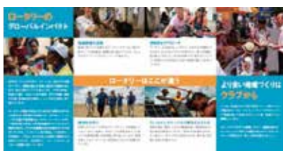
会員候補者向け資料:自分ができること 今日から始めよう(資料番号:001)

ロータリークラブにとって会員増強は最も重要な取り組みの一つです。今現在、十分な会員数に恵まれているクラブであっても時間の経過と共に会員も高齢化して行くのは当然のことです。したがって、会員増強はこれからのクラブを担う若い会員を少しずつ補強して、クラブのDNAを継承してもらわなければなりません。もちろん、新会員が入会することでアイデアが広がる可能性があります。新会員は活動する原動力になる可能性もあります。つまり会員増強は「活力あるクラブ作り」と言えるでしょう。