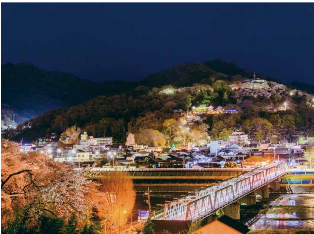
渡良瀬橋と織姫の桜