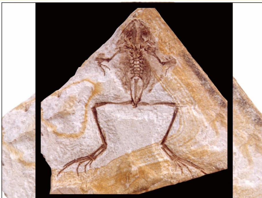
写真：那須塩原市中塩原 木の葉化石園 展示化石「シオバラカエル」