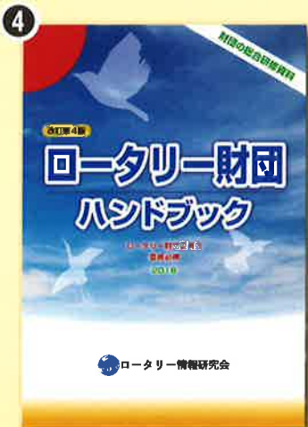
4 ロータリー財団ハンドブック (財団の総合研修資料)

ロータリー財団の概要から各種の活動および補助金、寄付の種類などを分かりやすく解説しており、用語集も網羅しております。 (2018年3月発刊)