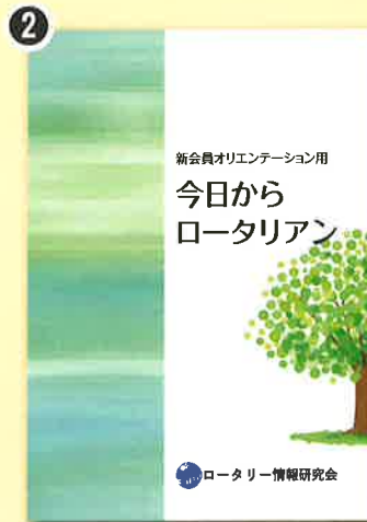
2 今日からロータリアン (新会員オリエンテーション用) 新会員のためのロータリー情報を1時間でわかるように、やさしく解説してあります。