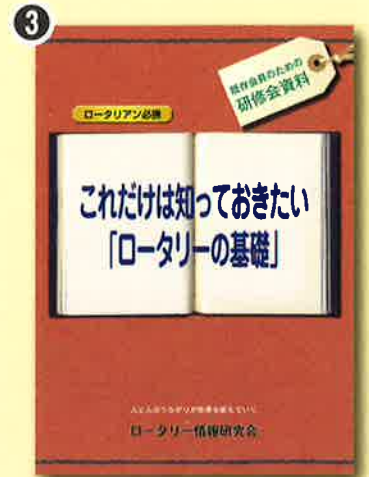
3 これだけは知っておきたい「ロータリーの基礎」 既存会員のためのロータリアン必携資料として、クラブでの研修などに最適な一冊です。